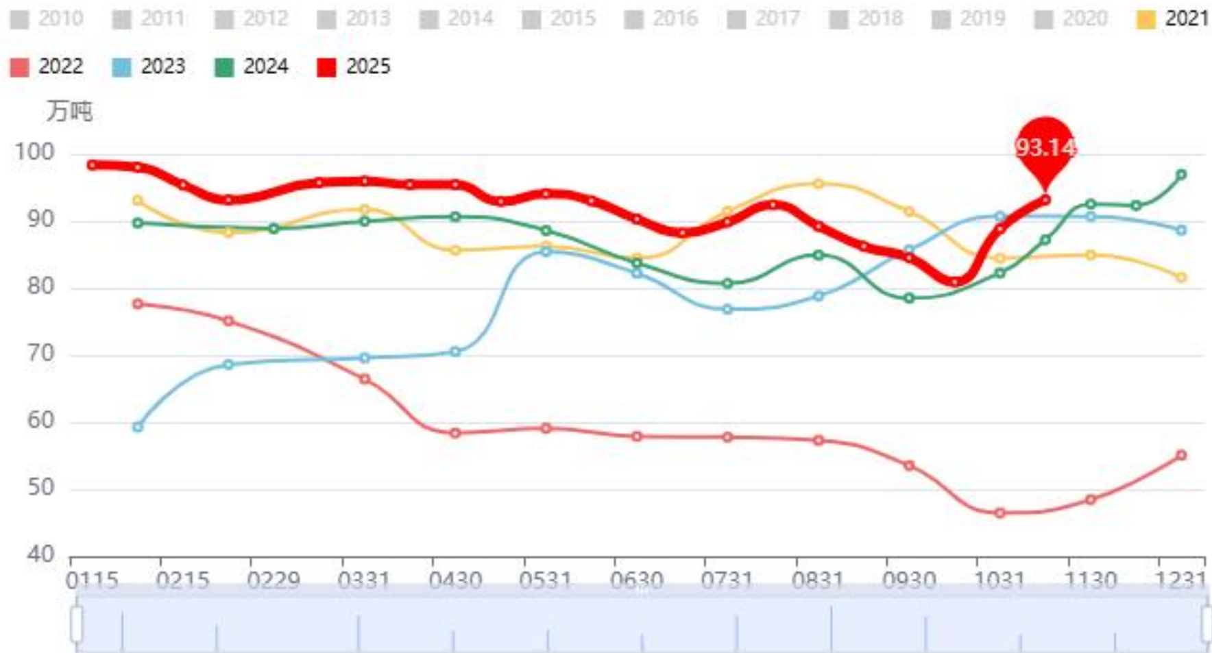
工业库存:棉花(月)(万吨) 数据更新日期:20251115